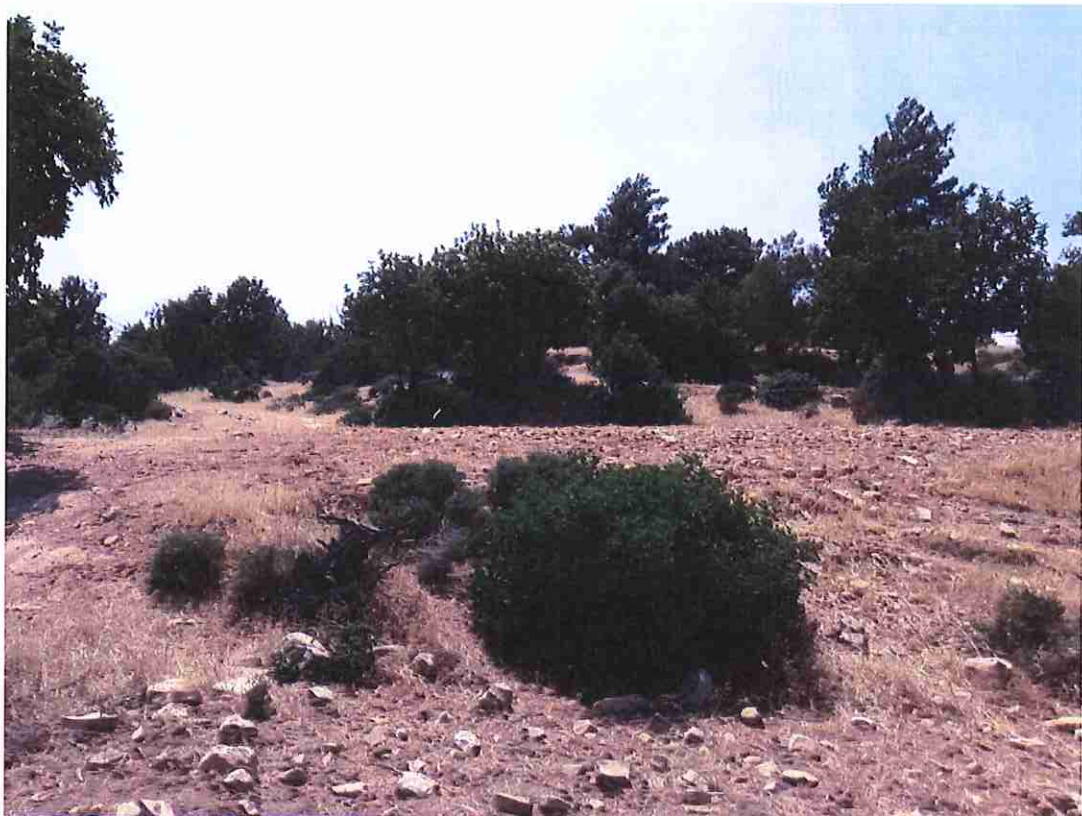
Μέρος του υπό εκτίμηση ακινήτου.