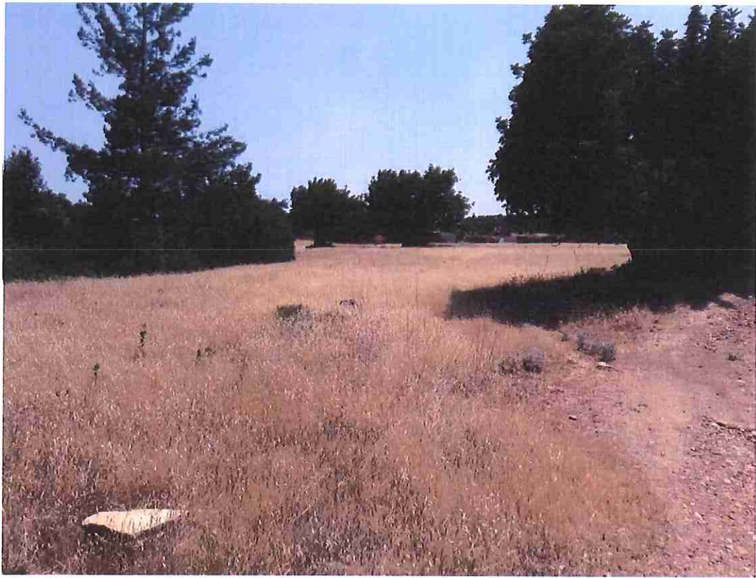
Μέρος του υπό εκτίμηση ακινήτου.