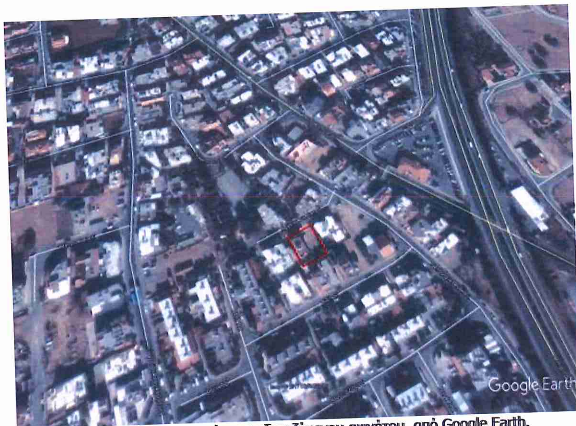
Δορυφορική φωτογραφία του εξεταζόμενου ακινήτου, από Google Earth.