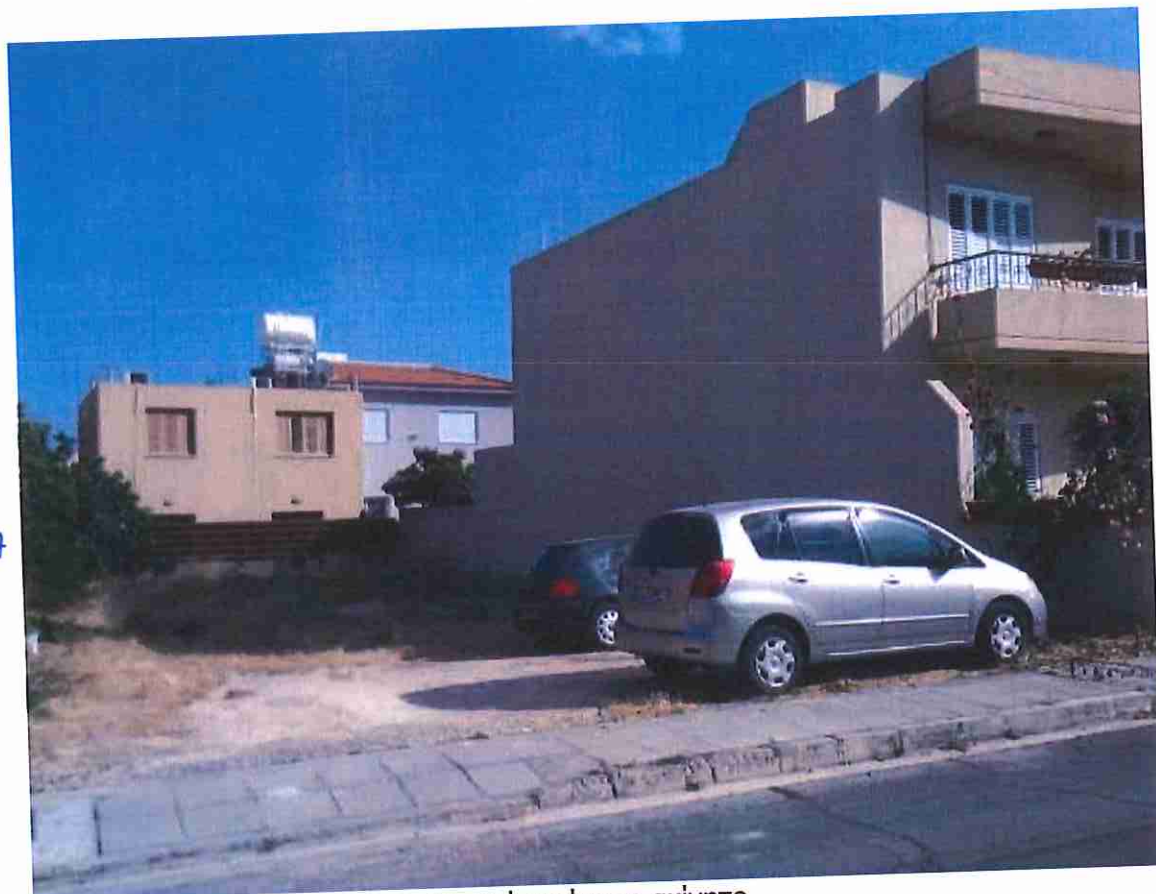
Το υπό εκτίμηση ακίνητο.