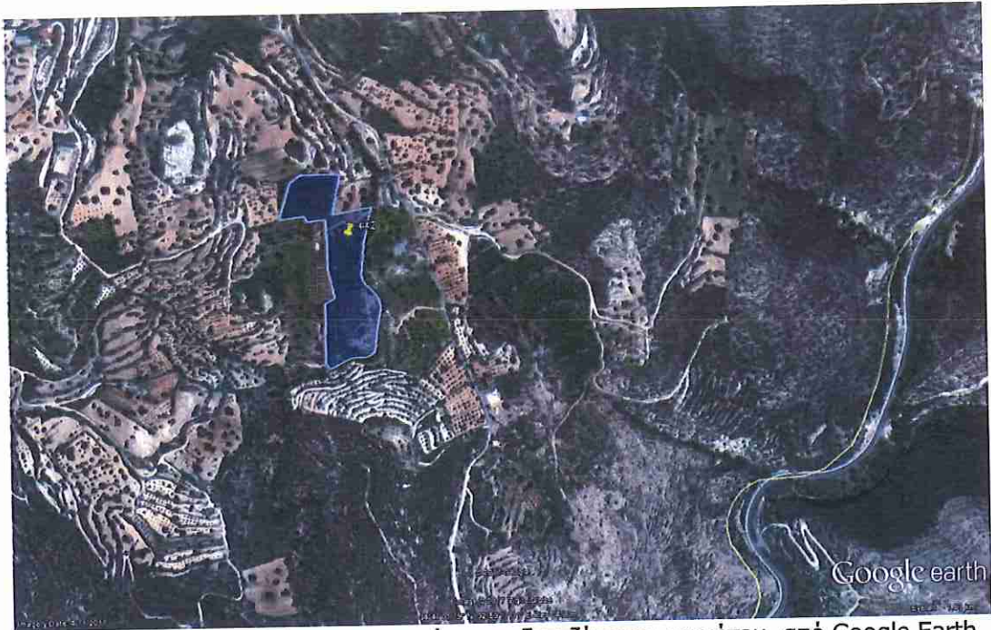
Δορυφορική φωτογραφία της περιοχής του εξεταζόμενου ακινήτου.